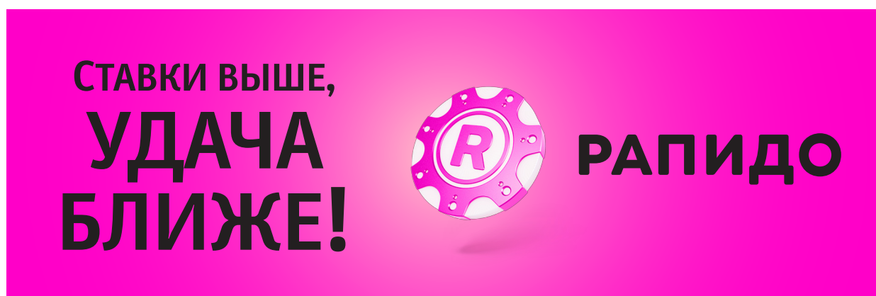
Логотип в свободной, «воздушной» композиции

Жестких требований по поводу охранного поля вокруг логотипа не существует — при многообразии форматов и задач лотереи их пришлось бы рано или поздно нарушить. На примерах ниже видно, что логотип одинаково хорошо смотрится и на просторе, и в относительной тесноте.