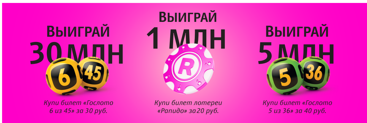
Логотип в плотной шрифтовой конструкции