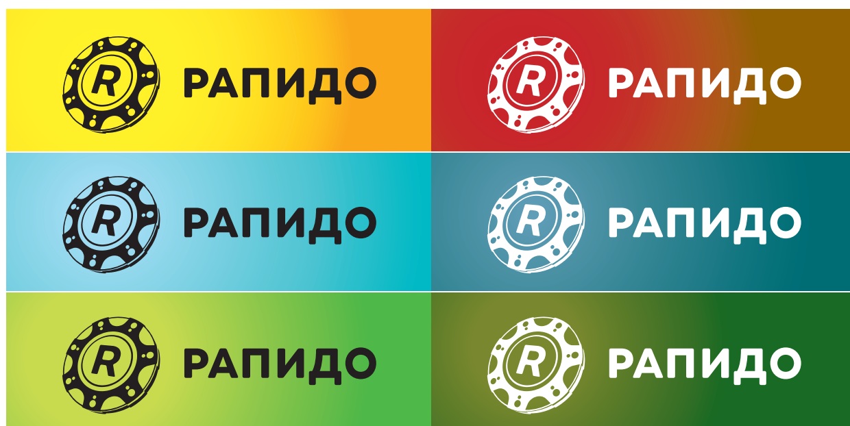
Монохромный логотип на простом цветном фоне

При размещении монохромного логотипа на простом цветном фоне необходимо выбирать черную или белую версию в зависимости от того, какая лучше контрастирует с фоном.