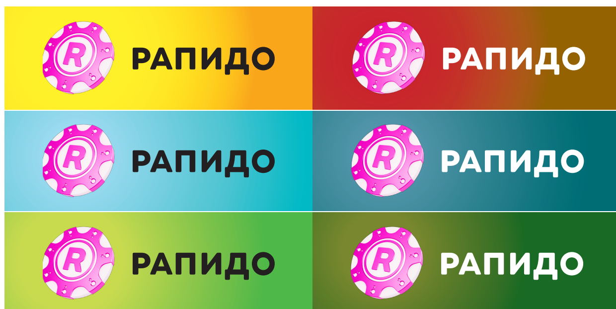
Полноцветный логотип на простом цветном фоне

При размещении на таком фоне полноцветной версии логотипа необходимо следить за тем, чтобы они хорошо контрастировали. Для этого следует выбирать по обстоятельствам белую или черную текстовую часть логотипа.